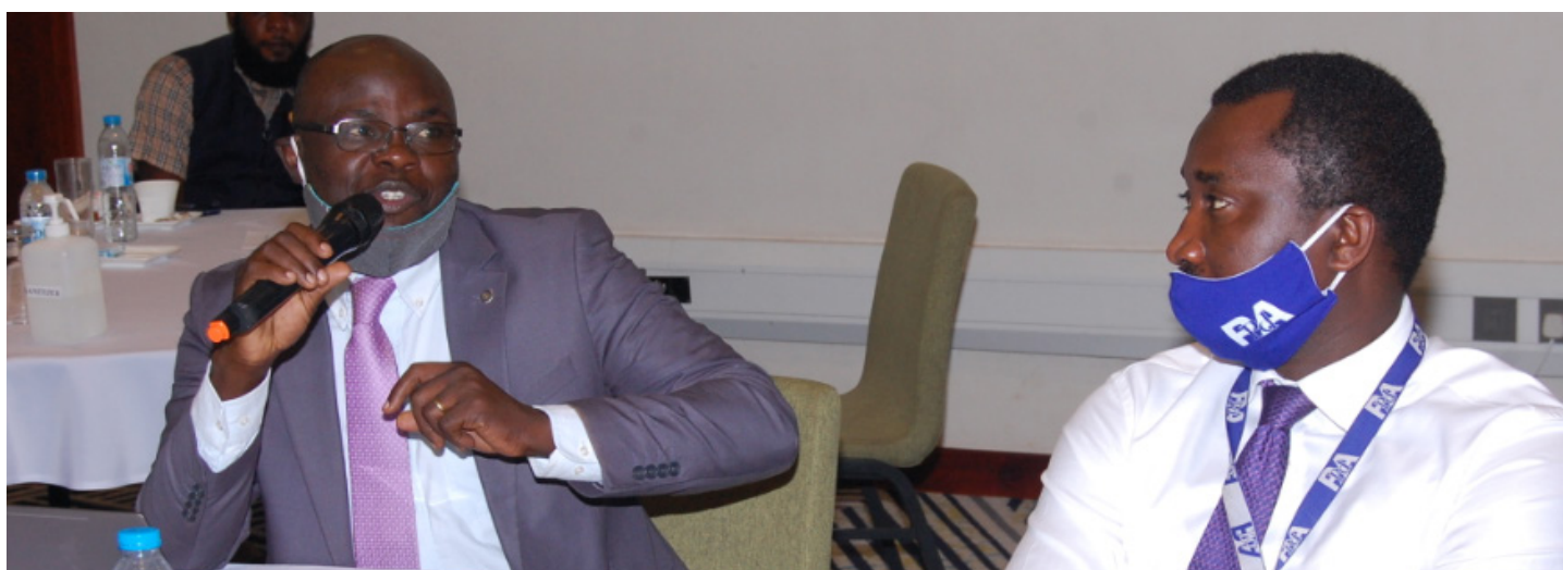
Funcionarios de gobierno en un taller de CoST Uganda sobre la divulgación de datos utilizando OC4IDS.