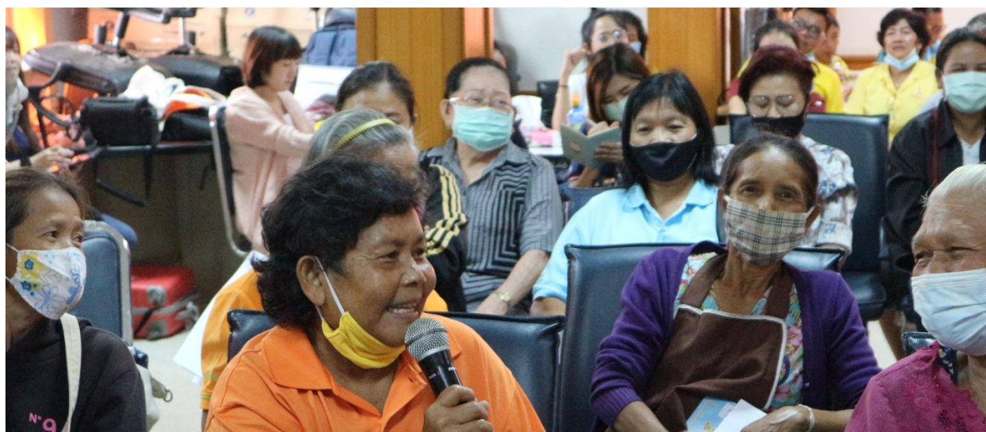
Miembros de una comunidad en Tailandia discuten la entrega de infraestructura local.

Después de la presentación y publicación de los resultados del ITI, es normal que las entidades contratantes y otros grupos de interés planteen dudas o inquietudes, soliciten reuniones de seguimiento y, en algunos casos, soliciten capacitación u otras formas de apoyo. Las organizaciones que dirigen el ITI deberán tener la capacidad para responder a estas necesidades.