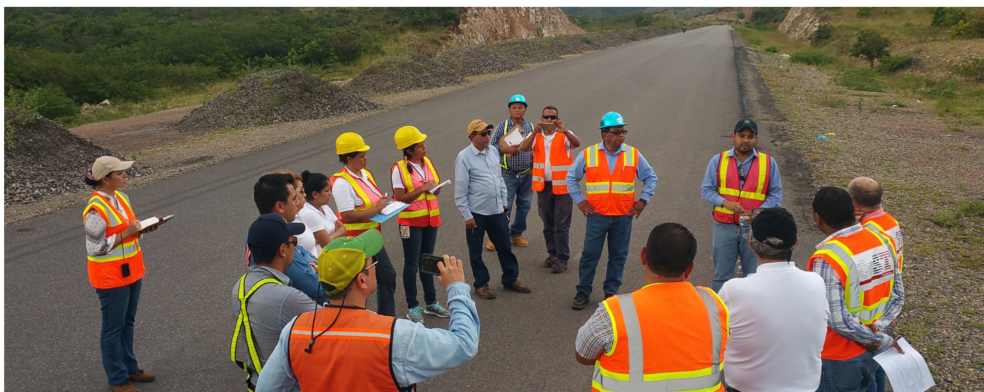
El Equipo de Aseguramiento de CoST Honduras realiza una visita al sitio.

El largo proceso fue necesario para garantizar que existía un enfoque sólido en el que las partes interesadas pudieran confiar. A su debido tiempo, la metodología y los índices se actualizarán para reflejar la experiencia y las lecciones adicionales obtenidas de su aplicación global.