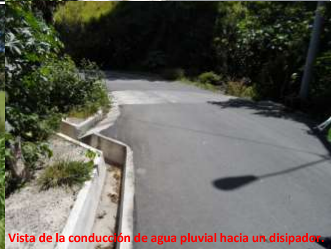
Vista de la conducción de agua pluvial hacia un dissipador.