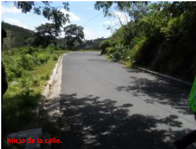
Inicio de la calle.