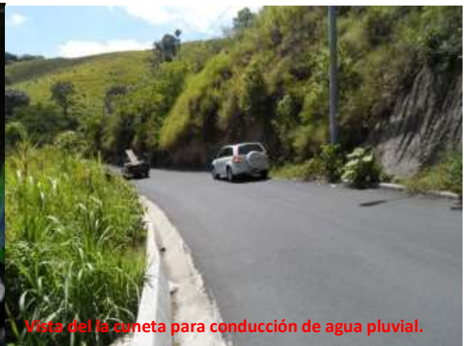
Vista de la cuneta para conducción de agua pluvial.