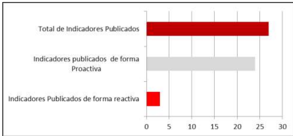
Gráfica 1: Tipo de Publicación de los Indicadores