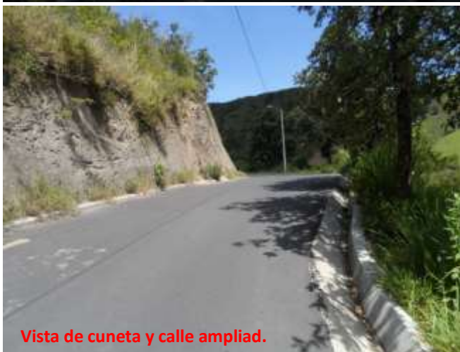
Vista de cuneta y calle ampliada.