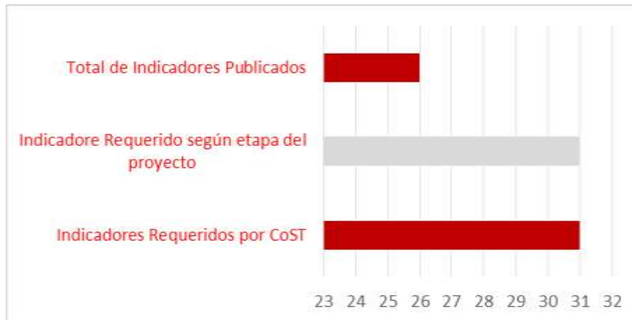
Gráfica 2: Publicación de Indicadores de acuerdo a la etapa del proyecto

De acuerdo al avance del proyecto, el cual se encontró finalizado, este debió cumplir con la publicación de treinta y uno (31) de los treinta y uno (31) indicadores requeridos por CoST (100%), mediante la evaluación realizada se cuantifico un 84% de cumplimiento en divulgación de indicadores. Estos resultados pueden observarse en la gráfica 2.