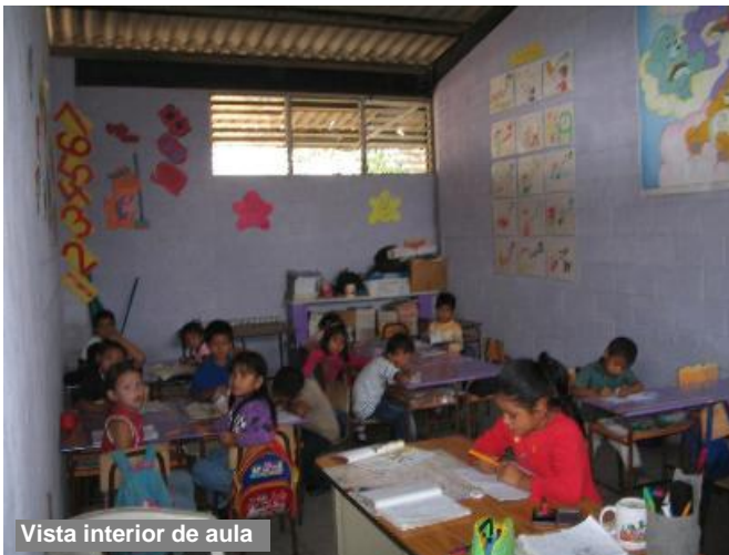
Vista interior de aula