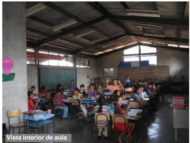
Vista interior de aula