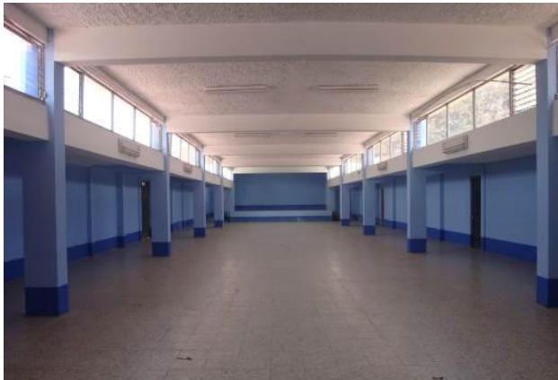
Ampliación del salón de usos múltiples