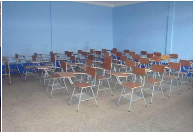
Pintura y equipamiento de aulas