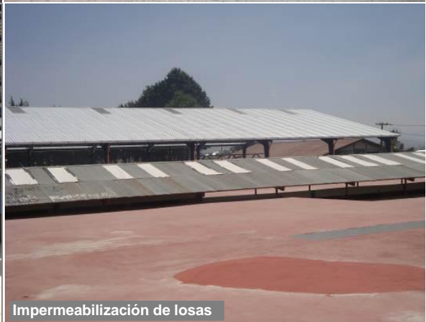
Impermeabilización de losas