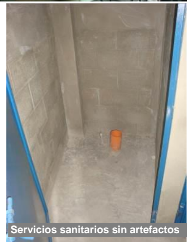
Servicios sanitarios sin artefactos