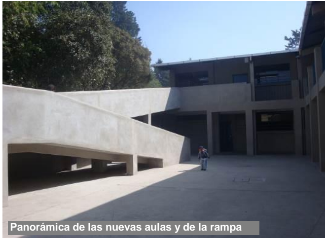
Panorámica de las nuevas aulas y de la rampa