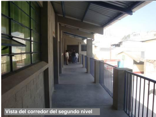
Vista del corredor del segundo nivel