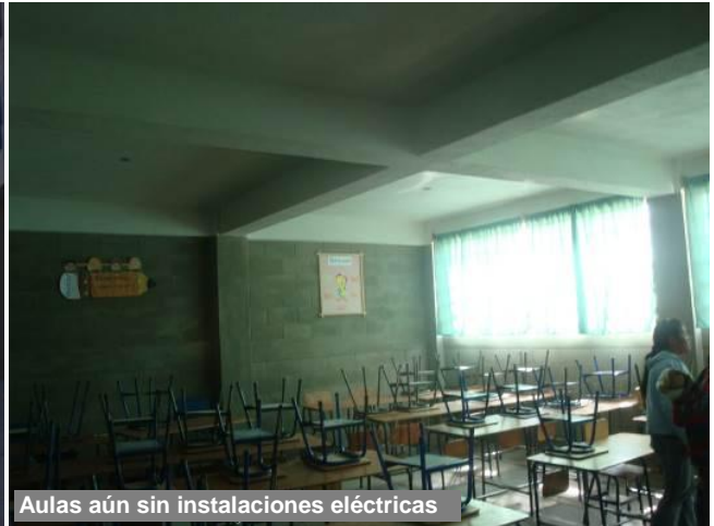
Aulas aún sin instalaciones eléctricas