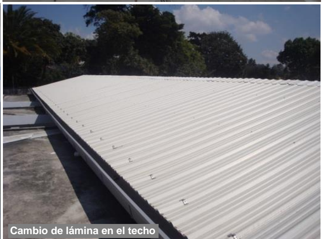
Cambio de lámina en el techo