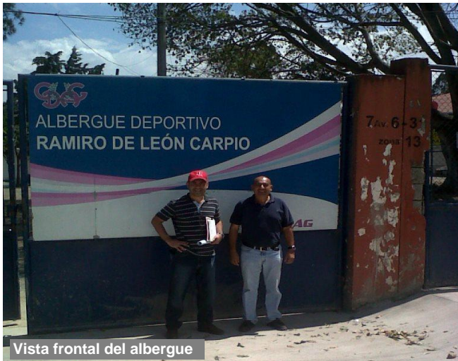
Vista frontal del albergue