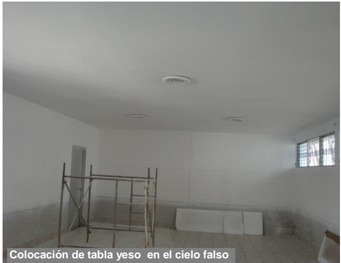
Colocación de tabla yeso en el cielo falso