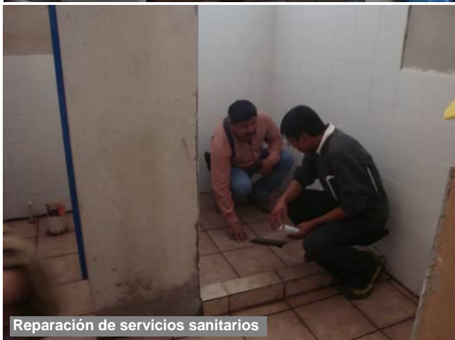
Reparación de servicios sanitarios