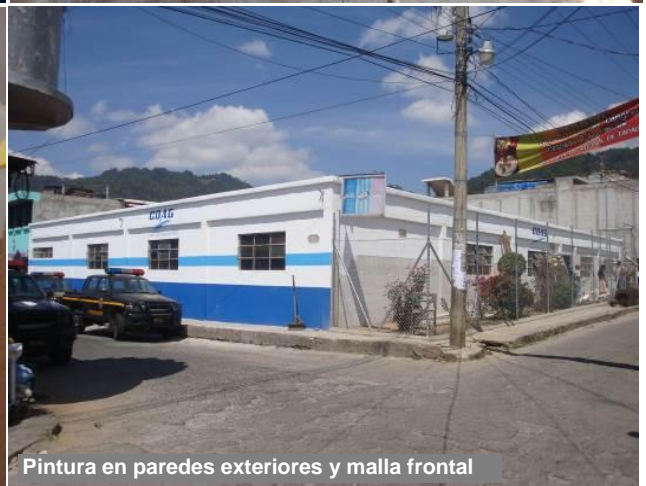
Pintura en paredes exteriores y malla frontal