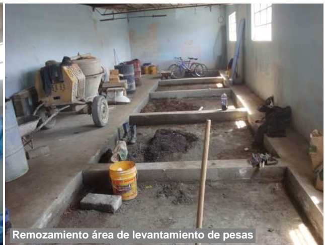
Remozamiento área de levantamiento de pesas