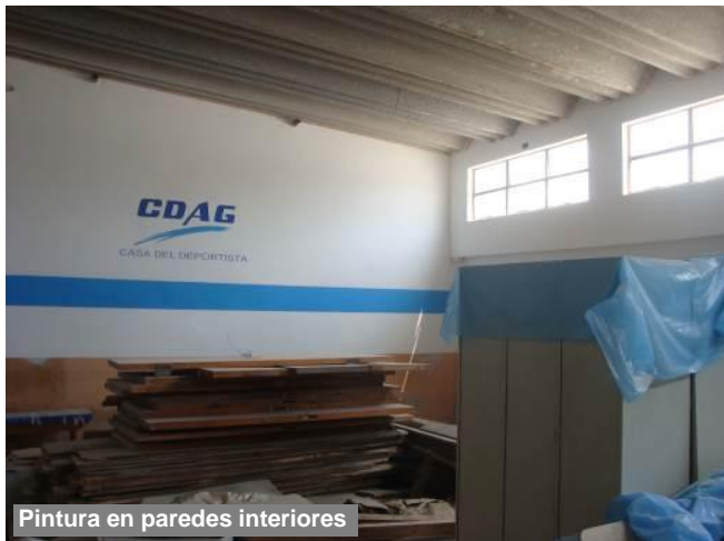
Pintura en paredes interiores