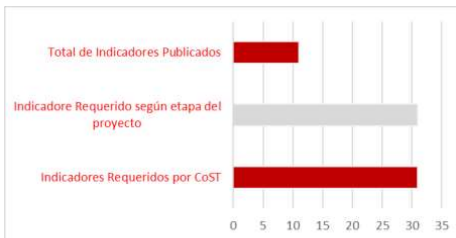
Gráfica 2: Publicación de Indicadores de acuerdo a la etapa del proyecto

De acuerdo al avance del proyecto, el cual se encontró finalizado, este debió cumplir con la publicación de treinta y uno (31) de los treinta y uno (31) indicadores requeridos por CoST (100%), mediante la evaluación realizada se cuantifico un 35 % de cumplimiento en divulgación de indicadores. Estos resultados pueden observarse en la gráfica 2.