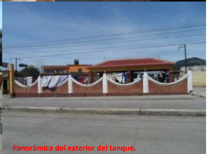
Panorámica del exterior del tanque.