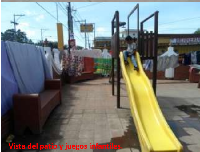
Vista del patio y juegos infantiles.