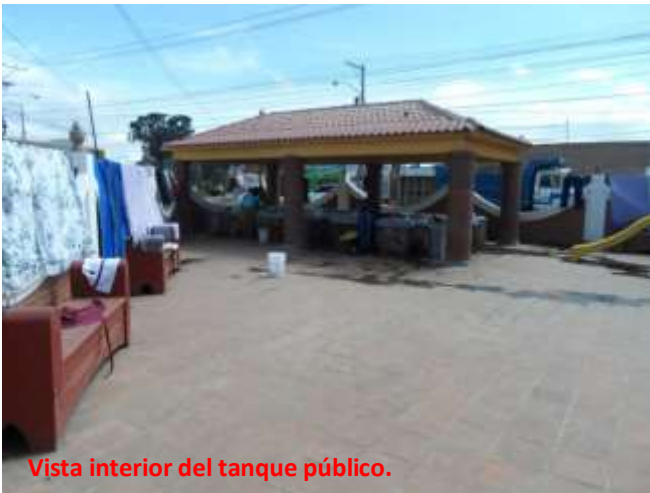
Vista interior del tanque público.