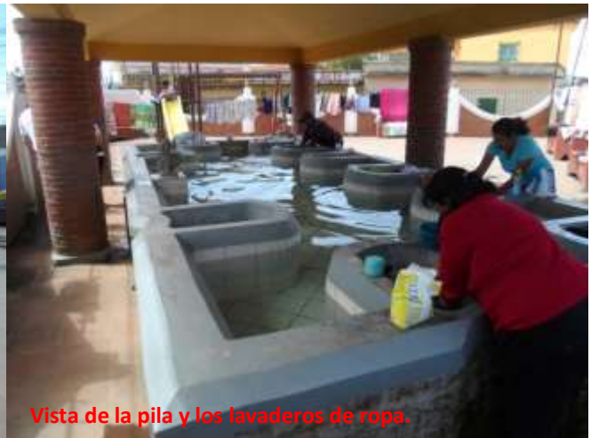
Vista de la pila y los lavaderos de ropa.