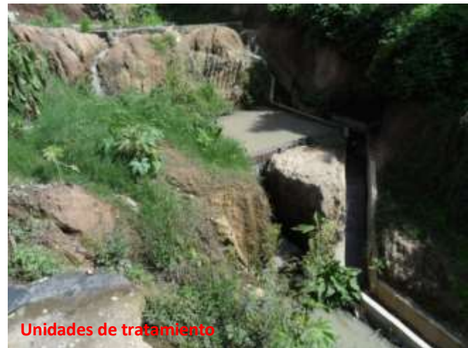
Unidades de tratamiento