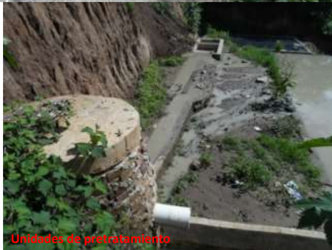
Unidades de pretratamiento