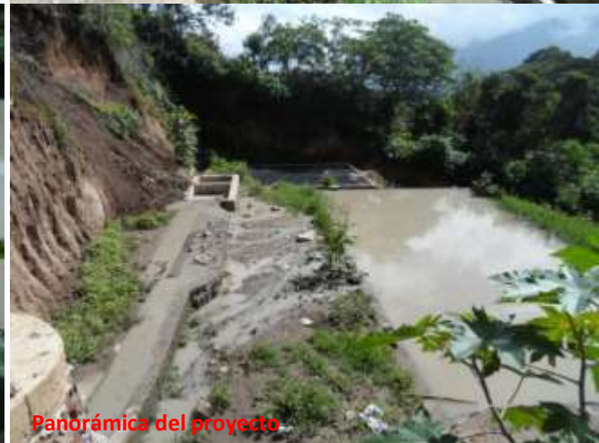
Panorámica del proyecto