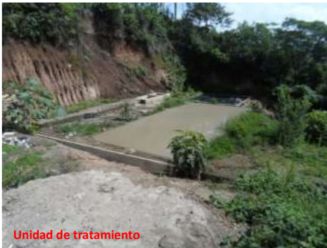
Unidad de tratamiento