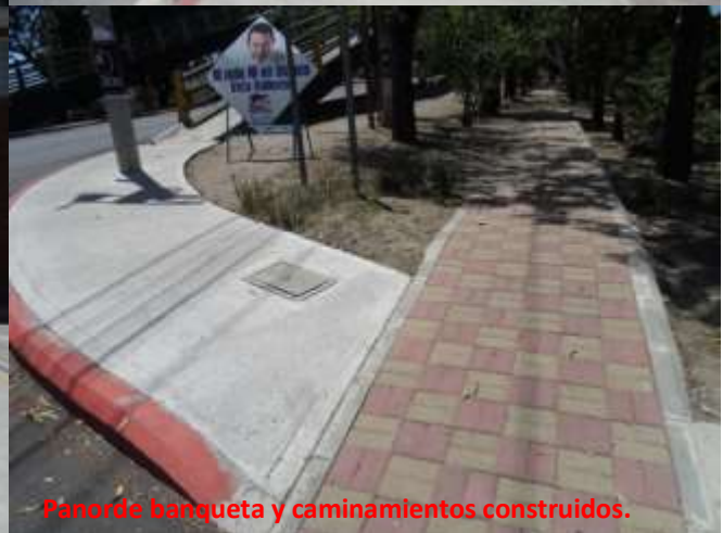
Panor de banqueta y caminamientos construidos.