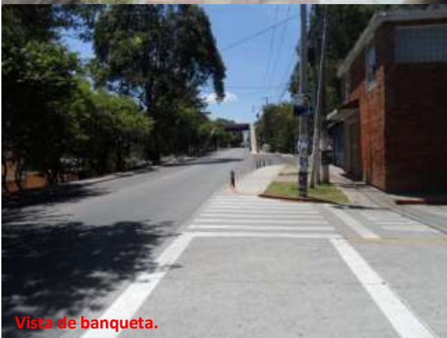
Vista de banqueta.