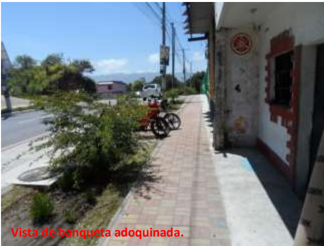
Vista de banqueta adoquinada.