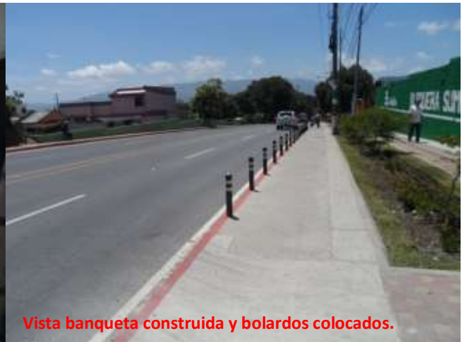
Vista banqueta construida y bolardos colocados.