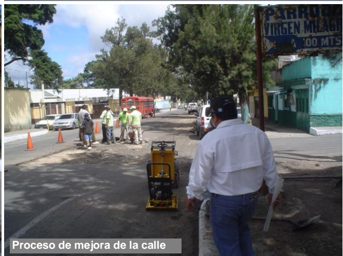
Proceso de mejora de la calle