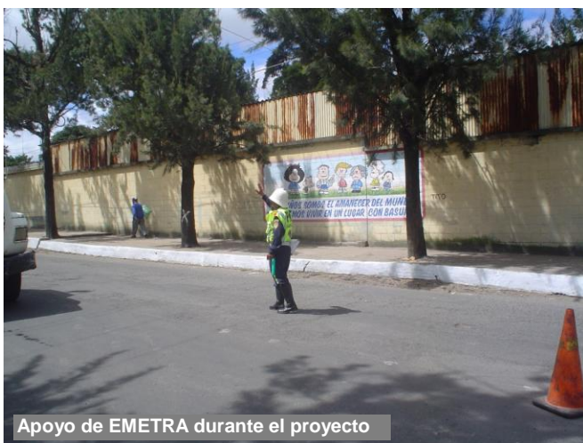
Apoyo de EMETRA durante el proyecto