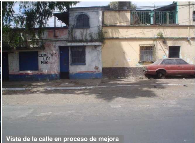
Vista de la calle en proceso de mejora