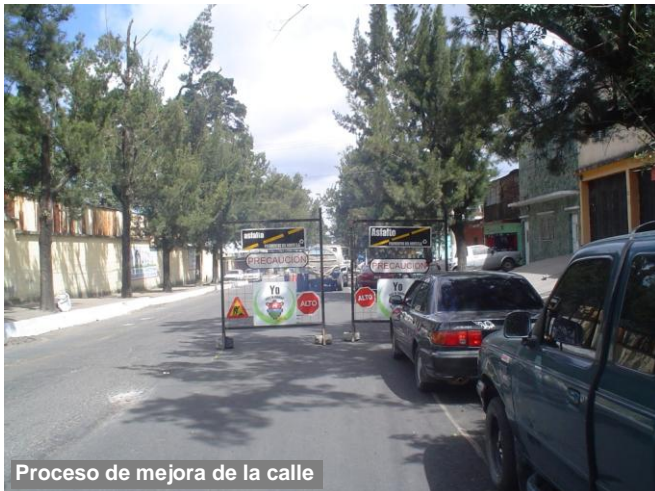
Proceso de mejora de la calle