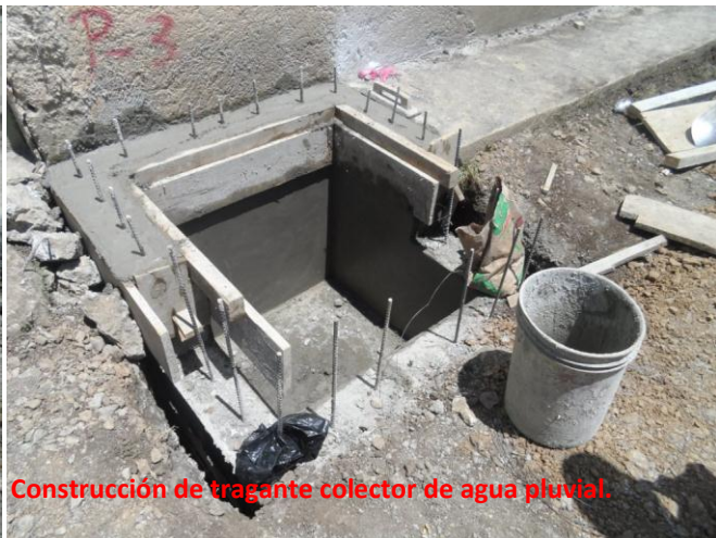
Construcción de tragante colector de agua pluvial.