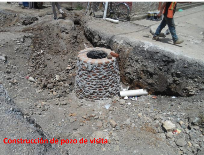
Construcción de pozo de visita.