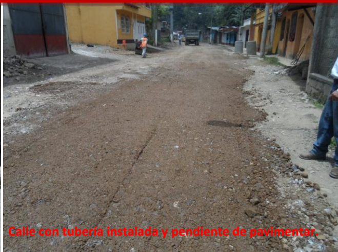
Calle con tubería instalada y pendiente de pavimentar.