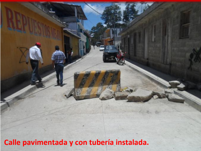
Calle pavimentada y con tubería instalada.