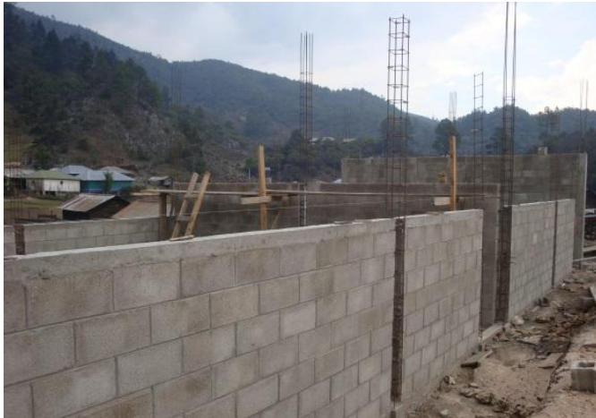
Inicio de construcción de aulas, sanitarios y exteriores