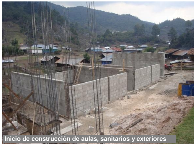
Inicio de construcción de aulas, sanitarios y exteriores