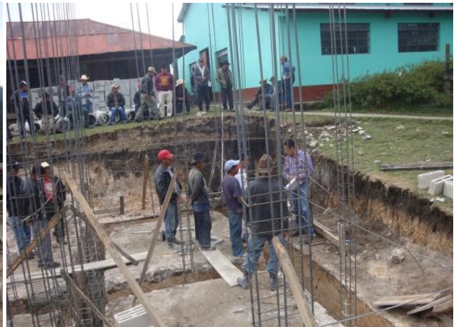
Inicio de construcción de aulas, sanitarios y exteriores