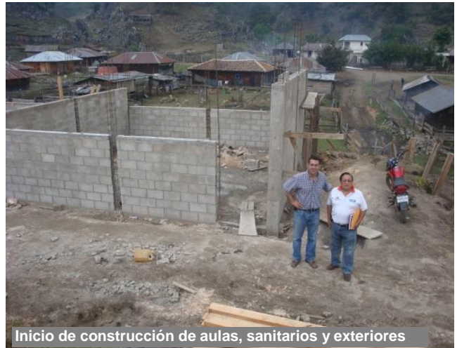
Inicio de construcción de aulas, sanitarios y exteriores