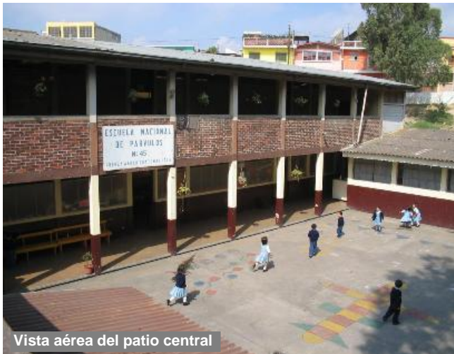
Vista aérea del patio central