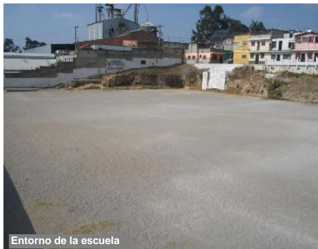
Entorno de la escuela