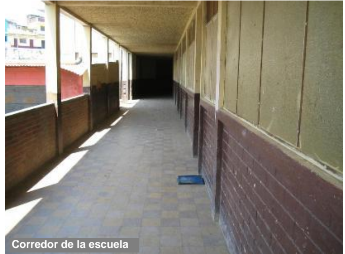
Corredor de la escuela